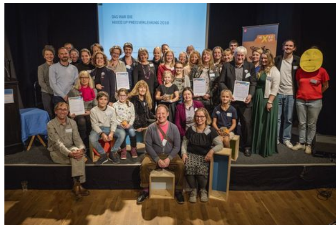
Foto: MIXED UP Preisverleihung 2018/alle Preisträger-Teams; © BKJ | Timo Wilke

Die neun Preisträger im diesjährigen Bundeswettbewerb für kulturelle Bildungspartnerschaften MIXED UP sind am 22. November 2018 im „musiculum – Lern- und Experimentierwerkstatt für Kinder und Jugendliche in Kiel“ für ihre herausragende Zusammenarbeit von der BKJ zusammen mit dem Bundesjugendministerium, dem Ministerium für Bildung, Wissenschaft und Kultur des Landes Schleswig-Holstein und der Initiative Austausch macht Schule ausgezeichnet wurden.