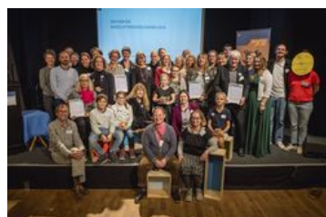
Alle Preisträger am 22. November 2018 bei der Preisverleihung gemeinsam

Bildergalerie in hoher Auflösung zum Download auf Flickr