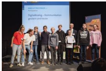
Preiskategorie Partizipation; „DigitalAnalog - Kommunikation gestern und heute“, SuB Kultur e. V. Berlin mit der Carl-von-Linné-Schule für Körperbehinderte in Berlin-Lichtenberg im Rahmen des Landesprogramms Kulturagenten für kreative Schulen Berlin; Foto: BKJ | (c) Timo Wilke