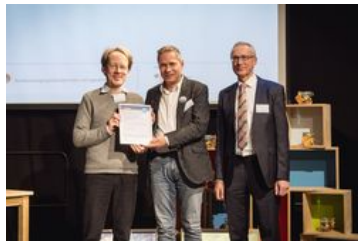
Preiskategorie Dauerbrenner; „Zusammenspiel“, Stiftung Klavier-Festival Ruhr in Essen mit Schulen in Duisburg-Marxloh; Foto: BKJ | (c) Timo Wilke