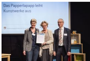
Preiskategorie KitaPlus; „Das Papperlapapp leiht Kunstwerke aus“, Kinderladen Papperlapapp e. V. und artothek – Raum für junge Kunst Köln; Foto: BKJ | (c) Timo Wilke