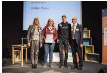
Preiskategorie Ländlicher Raum; „Hidden Places“, DKB Stiftung mit der freiberuflichen Künstlerin Kathrin Karras und der EXIN-Oberschule in Zehdenick; Foto: BKJ | (c) Timo Wilke