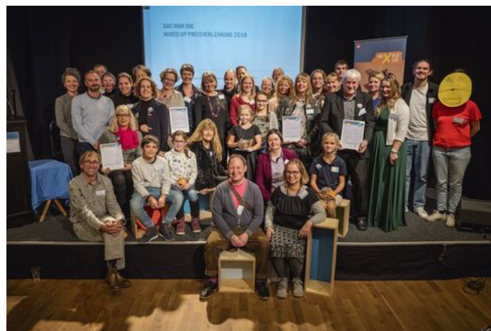
Foto: MIXED UP Preisverleihung 2018/alle Preisträger-Teams

Die neun Preisträger im diesjährigen Bundeswettbewerb für kulturelle Bildungspartnerschaften MIXED UP sind am 22. November 2018 im „musiculum – Lern- und Experimentierwerkstatt für Kinder und Jugendliche in Kiel“ für ihre herausragende Zusammenarbeit von der BKJ zusammen mit dem Bundesjugendministerium, dem Ministerium für Bildung, Wissenschaft und Kultur des Landes Schleswig-Holstein und der Initiative Austausch macht Schule ausgezeichnet wurden.