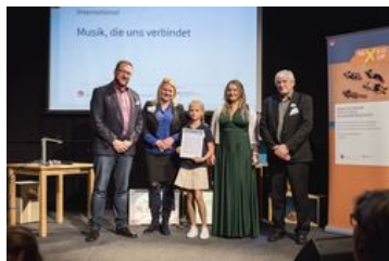
Preiskategorie International; „Musik, die uns verbindet“, Fanfaregarde Frankfurt an der Oder e. V. mit dem Kulturhaus Smok, Słubice, der Szkola Podstawowa Nr. 1, Słubice und der Astrid-Lindgren-Grundschule in Frankfurt a. d. Oder; Foto: BKJ | (c) Timo Wilke