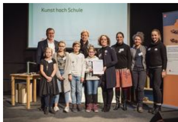
Länderpreis Schleswig-Holstein; „Kunst hoch Schule“, Muthesius Kunsthochschule mit der Käthe-Kollwitz-Schule und weiteren Schulen und Künstler*innen aus Schleswig-Holstein; Foto: BKJ | (c) Timo Wilke