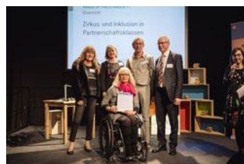
Preiskategorie Diversität; „Zirkus und Inklusion in Partnerschaftsklassen“, Lisamartoni e. V. in Böblingen, Lise-Meitner-Gymnasium Böblingen und Martinsschule Sindelfingen; Foto: BKJ | (c) Timo Wilke