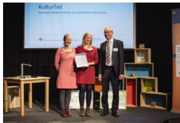
Preiskategorie Bildungslandschaft; „KulturTeil – kulturelle Teilhabe für Kinder und Jugendliche in Neumünster“, Kulturbüro der Stadt Neumünster unter Beteiligung aller Kitas und Schulen in Neumünster; Foto: BKJ | (c) Timo Wilke