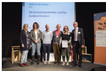
Preiskategorie Kita; „Die Geräuschesammler und Das Goldene Knistern“, Geräusch [mu'sik] mit FIPP e. V., der Kita Sonnenschein, der Kita Warthestraße und der Kita Biesdorfer Zwergenhaus in Berlin; Foto: BKJ | (c) Timo Wilke